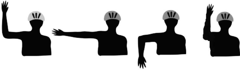
Подача предупредительных сигналов (вид сзади)